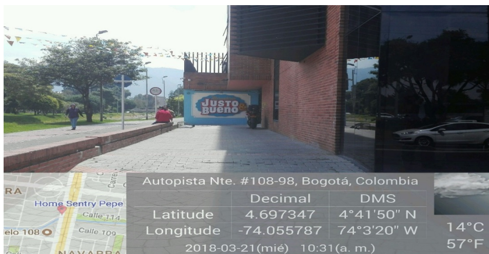
Fotografía No 3 aviso en fachada el cual excede el 30 %.