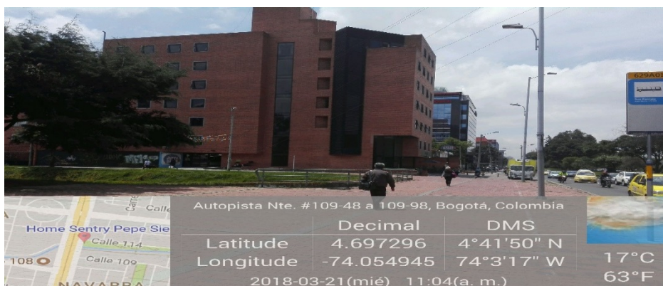
Fotografía No 1. Fachada del predio donde se ubica el establecimiento de comercio denominado