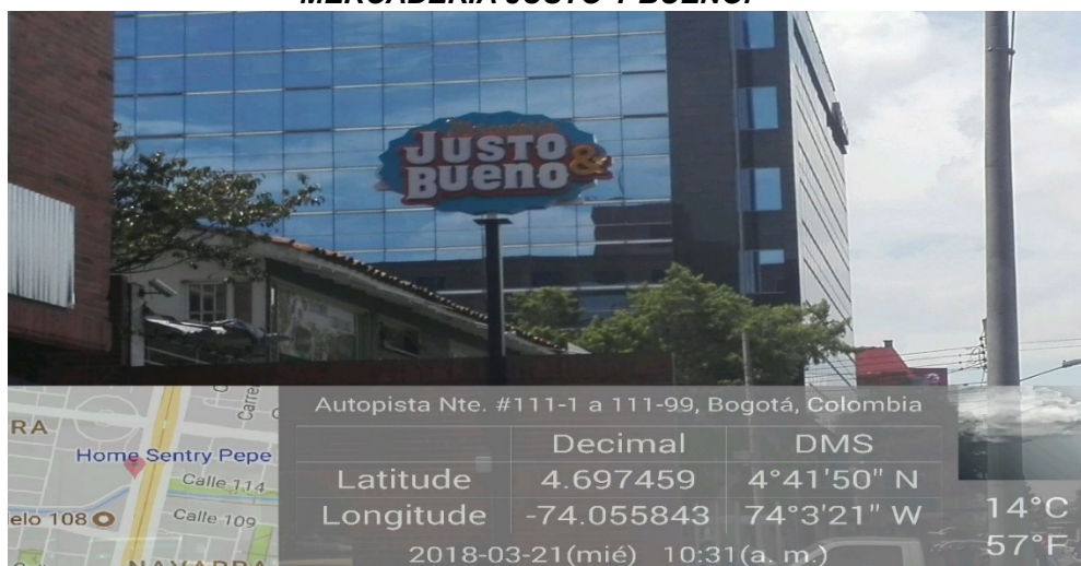
Fotografía No 2. Aviso separado de fachada ubicado sobre la avenida carrera 45 sentido norte- sur.